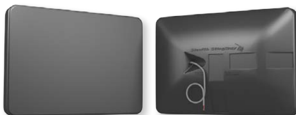
Černá povrchová úprava

Stealth Acoustics StingRay 8™ je širokopásmový, vysoce kvalitní, 8" dvoupásmový venkovní reproduktor chráněný proti povětrnostním podmínkám využívající technologii utěsnění čelního zářiče v krytu bez mřížek nebo jiných otvorů . StingRay 8™ je vybaven vyzařujícím povrchem Fidelity Glass™ společnosti Stealth vyrobeným z mimořádně odolných a neproniknutelných skelných vláken, která odolají přírodním silám jako např. slaná voda, sluneční svit nebo extrémní teploty, při poskytování plného a přirozeného zvuku pro reprodukci hudby nebo mluveného slova. StingRay 8™ nabízí značnou výhodu oproti tradičním venkovním reproduktorům. Tento reproduktor je nepropustný vůči povětrnostním vlivům a může být umístěn téměř do jakéhokoliv venkovního prostředí .